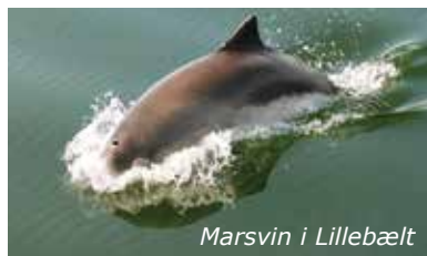
Marsvin i Lillebælt