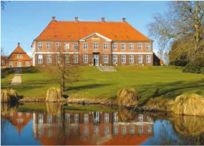
Hindsgavl-halvøen gemmer på mange spændende historier.