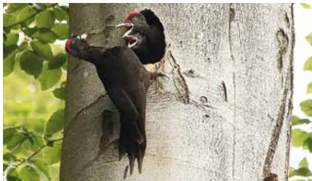
Sortspætten fodrer sine unger.

I vandhullerne finder du stor vandsalamander og en lang række andre padder. Læg turen forbi dyrehavens mange vandhuler en lun forårsaften, hvor luften er tyk af frøernes livlige kvækken.