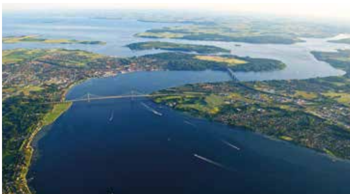
Lillebæltsbroer, sund og bælt. Hindsgavlhalvøen hygger sig midt i det hele.

Med kommunens overtagelse er den traditionelle skov- og landbrugsdrift efterhånden blevet omlagt. Halvøen har udviklet sig til en bæredygtig naturpark og dyrehave med plads til alle og med respekt for naturen, samtidig med at Danmarkshistorien har efterladt sig spor helt tilbage til 1600-tallet. Via den 10 kilometer lange sti 'Halvøen rundt' går natur, kultur og rekreative oplevelser hånd i hånd.